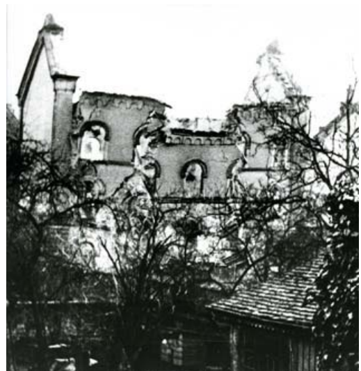
Der letzte Zerstörungsakt: Mai 1938