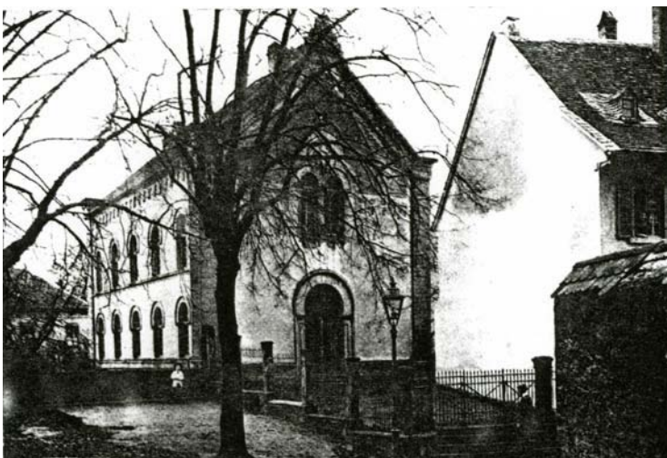
Ehemalige Synagoge in Kirchheimbolanden Sprengung der ausgebrannten Synagoge

Samstag, 9. November 18:00 Uhr Vorplatz ehemalige Synagoge